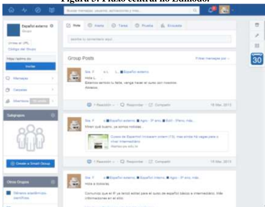
Figura 3: Fluxo central no Edmodo.

Através das ferramentas avaliativas, pode-se propor atividades direcionadas a um ou mais grupos, estipulando data de entrega e duração de cada atividade. Junto às ações propostas, foram anexados arquivos ou links complementares, os quais serviram para a consulta dos estudantes durante a realização de uma dada atividade (ver Figura 3).