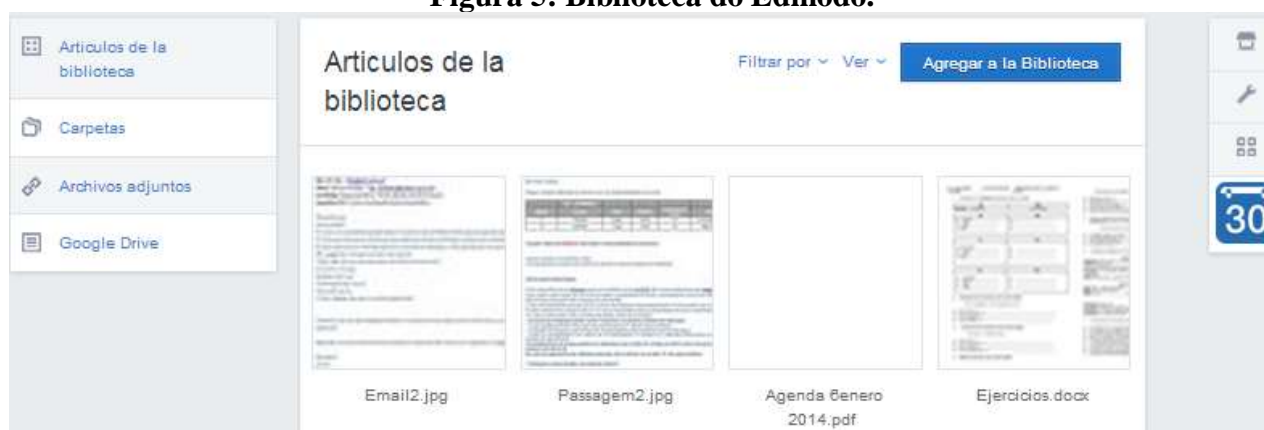
Figura 5: Biblioteca do Edmodo.