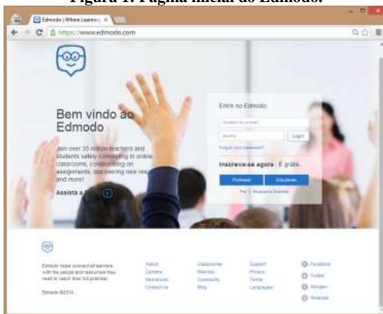
Figura 1: Página inicial do Edmodo.

Esta plataforma baseia-se em um modelo de aprendizagem colaborativa, o qual busca utilizar as mídias sociais como ferramenta para o gerenciamento do ensino e aprendizagem dos seus participantes, criando um ambiente de ensino personalizado para cada classe de usuário, conforme a Figura 1.