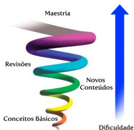
Figura 2 - Esquema do currículo em espiral